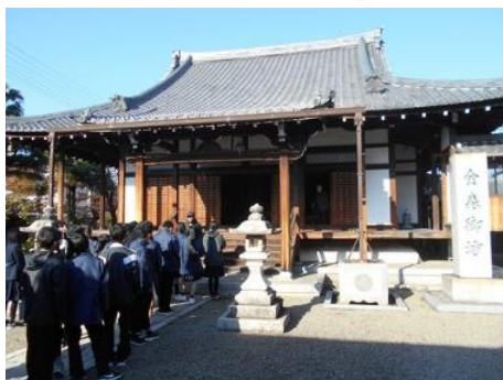
金森御坊の境内にて

地域を学ぶことは、過去をただ知るだけではありません。自分が暮らす場所を理解し、その価値に気づくことで、未来をより良くする力が育まれます。本校ではこれからも地域とともに学ぶ教育を大切にしていきたいと思います。