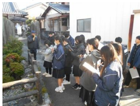
「蓮如杖掘りの池」の前で